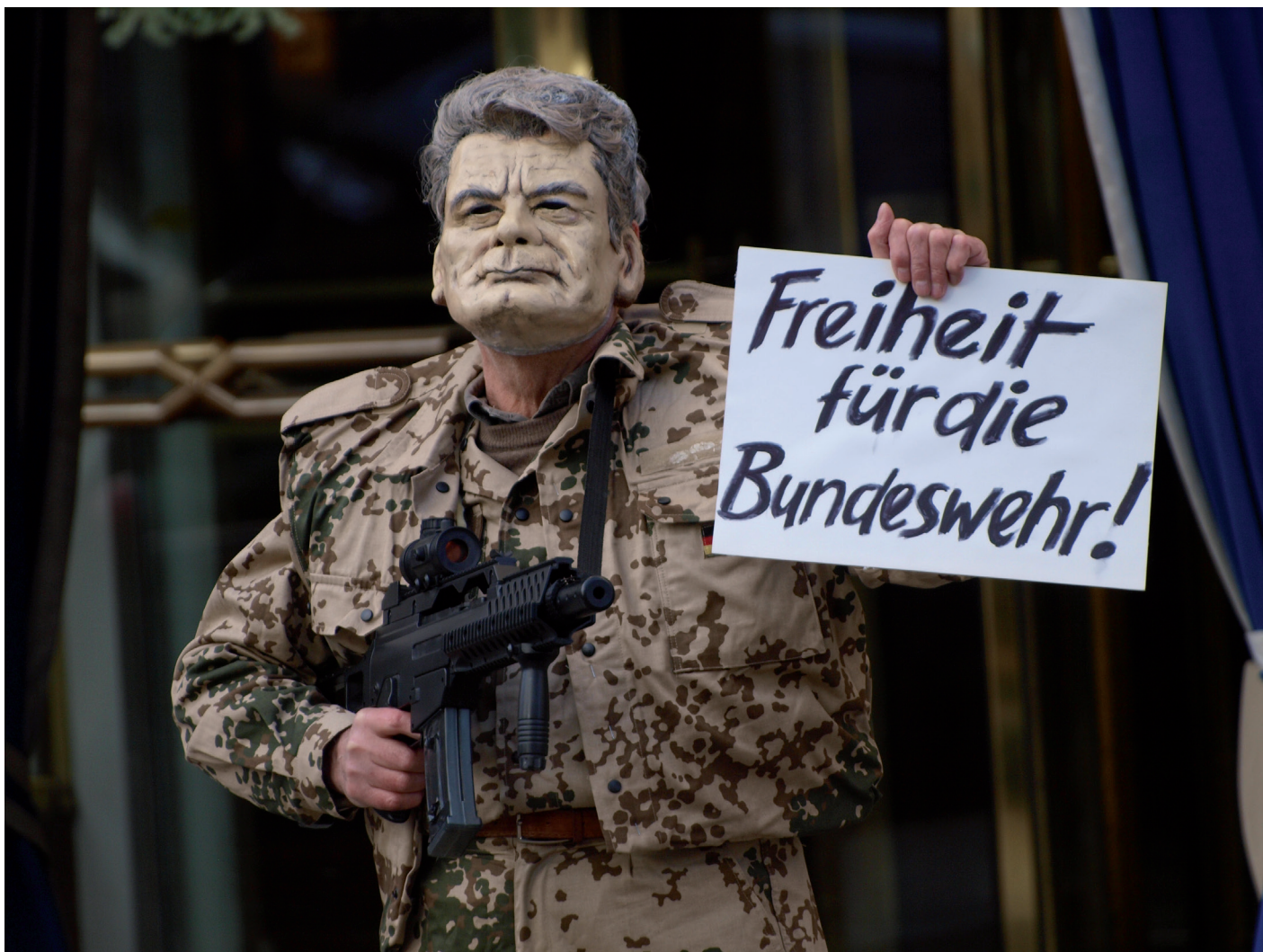
Protest gegen Gauck bei der Münchner Sicherheitskonferenz 2014