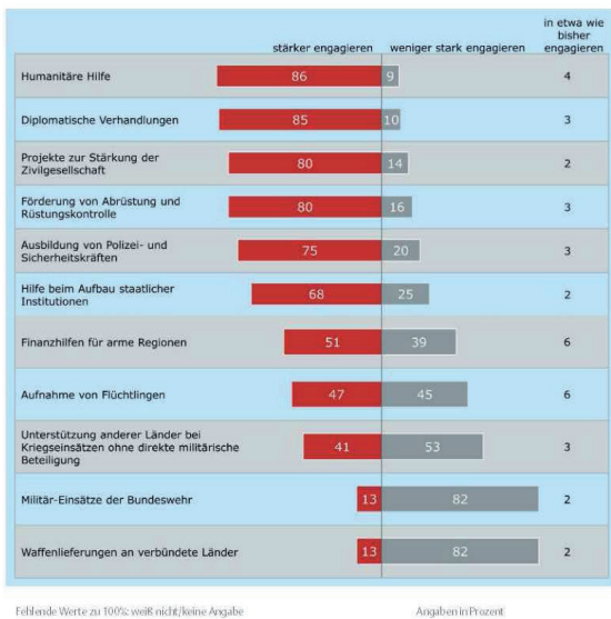
Wo soll sich Deutschland engagieren?

Einmischen oder zurückhalten? Ergebnisse einer repräsentativen Umfrage von TNS Infratest Politikforschung zur Sicht der Deutschen auf die Außenpolitik, Körber-Stiftung 2014, S. 5