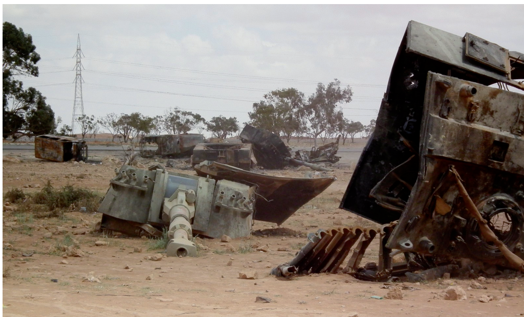
Libyen-Krieg: Hinterlassenschaften internationaler „Verantwortungspolitik“.

Bekanntlich hat der Westen bis heute (noch) nicht direkt militärisch in Syrien interveniert, die Tatsache aber, dass zumindest die Schwarz-Gelbe Bundesregierung ohnehin wenig Enthusiasmus an den Tag legte, den Verbündeten im Zweifelsfall beispringen